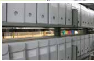
伊方原発行政訴訟資料